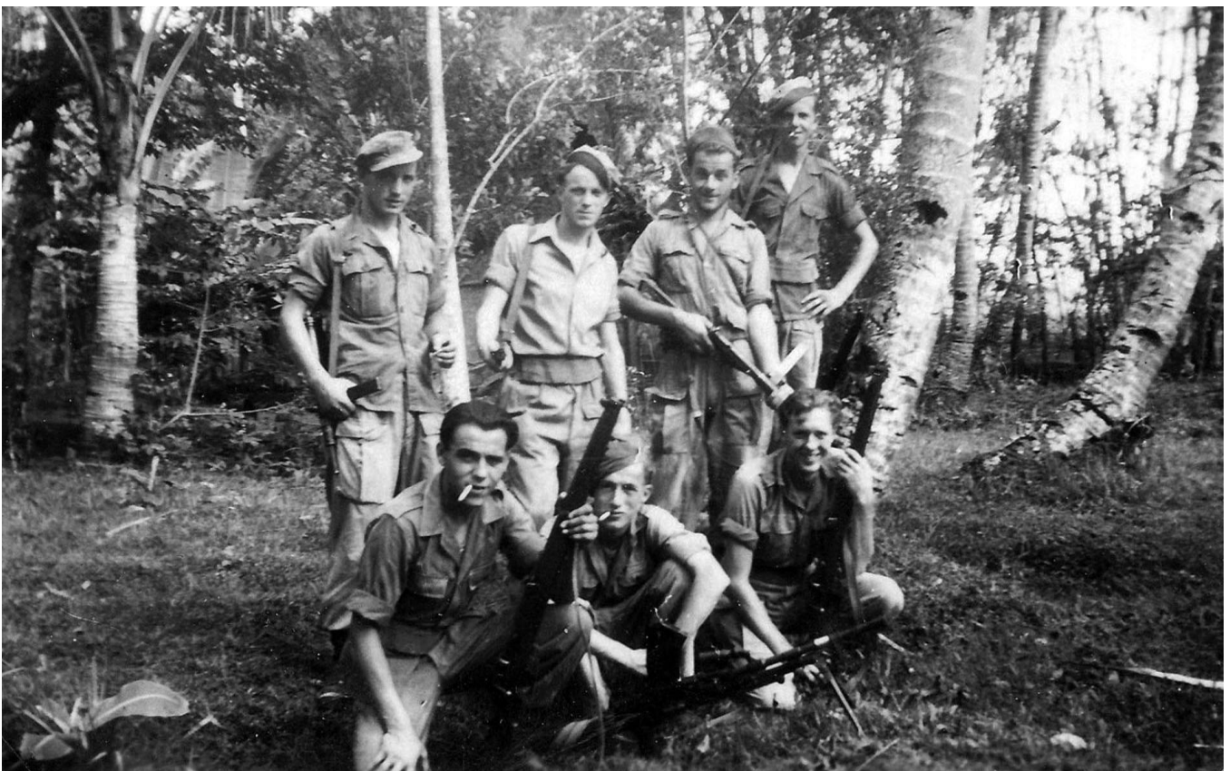
Foto: 411 bataljon infanterie, tweede peloton, eerste compie - Opleidingscentrum Soemowono

De lezing begint om 19.30 uur en zal ongeveer anderhalf uur in beslag nemen. De toegang bedraagt 5 euro p.p. en kan op de avond zelf worden voldaan.